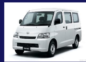
TOWN ACE (VAN)