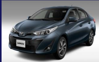
YARIS & VIOS