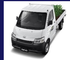
TOWN ACE (PICK UP)